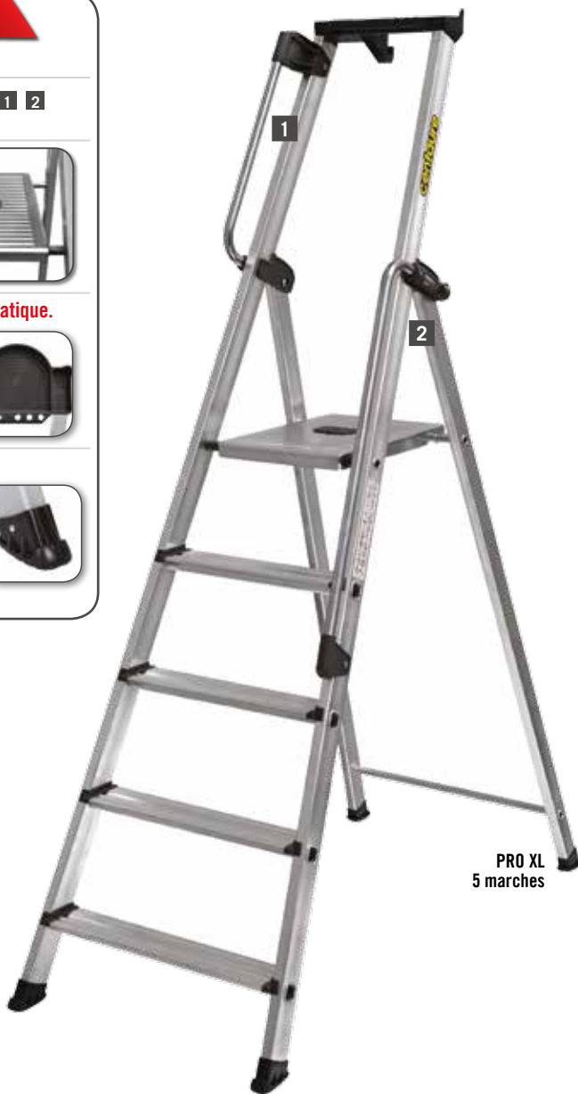
PRO XL 5 marches