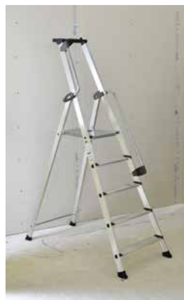
PRO XL 5 MARCHES