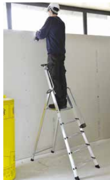
PRO XL 5 MARCHES